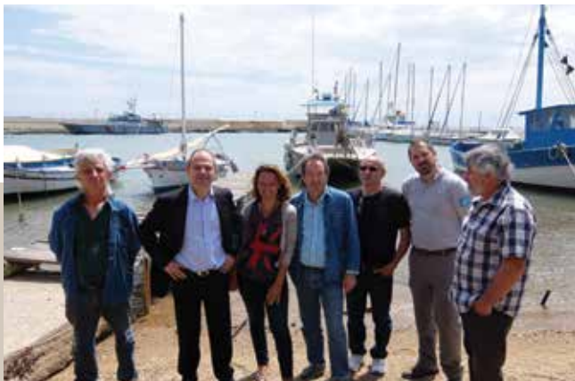
Signature de la convention avec le Comité des pêches